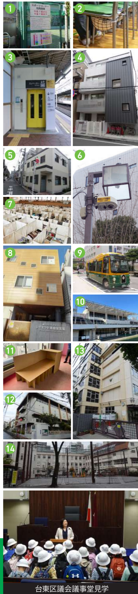
台東区議会議事堂見学 育英幼稚園PTA総副会長 台東育英小学校第5代PTA会長 台東区議会第66代副議長 令和5年台東区議会議員4期目当選